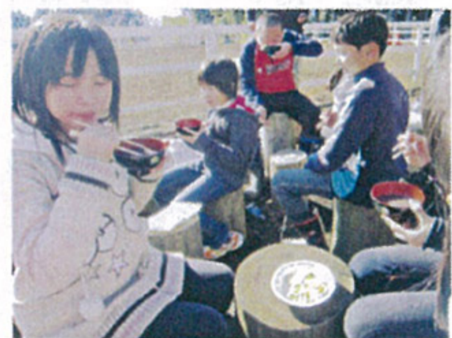
↑甘くて、おもちも入ったおしるこ。たくさんおかわりしたよ! おいしかったねエ