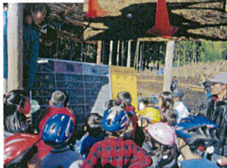
↑点数発表 今年白組の優勝!