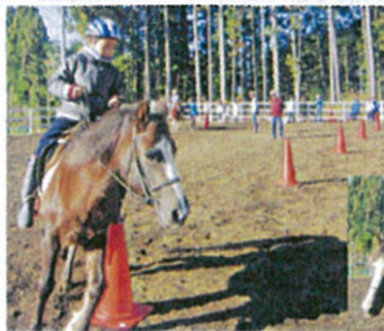
3、4年生スラロームリレー