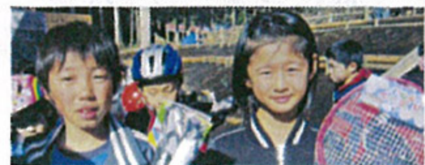
↓下のふたりは、打球の得点王と巻乗り王 1番に賞品を選ぶ権利を得ました。