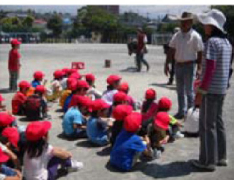
←6/4 大宮小学校訪問 ニンジンもたくさん もらいました