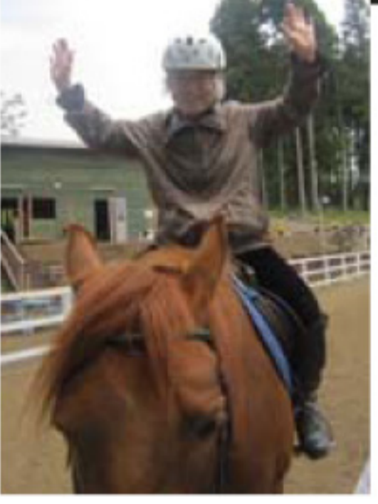
↑ 5/17 藤枝から平均年齢 60 うん才?の元気な方々が来 場。今回で2回目。秋にも 来たいとやる気満々。 乗馬はホントに心身ともリ フレッシュできます。