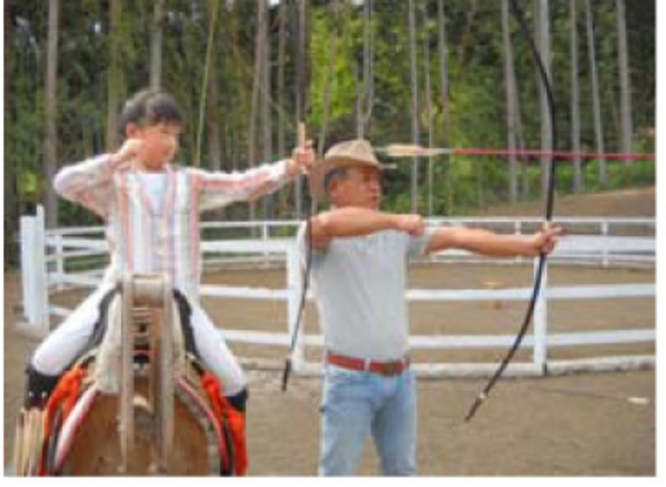
←6/6 古典馬術やぶさめ 今年から挑戦する子に、木馬で弓の 引き方をていねいに指導します。 今年は馬も自分でしっかり動かせる ようにと、乗馬にも力が入ります。