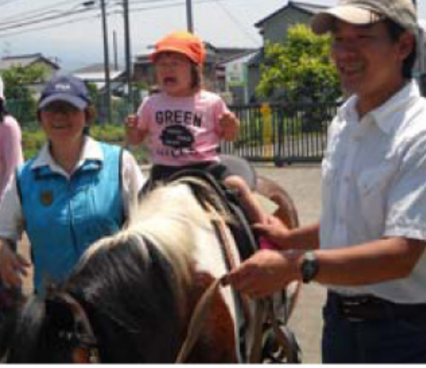
←6/10 大中里保育園訪問 大中里保育園では今年から、 動物(馬)介在保育としてポ ニーとのふれあいを年2回 企画し、第1回を終了。0才 ~5才児までほとんどの子 が楽しく乗りました。