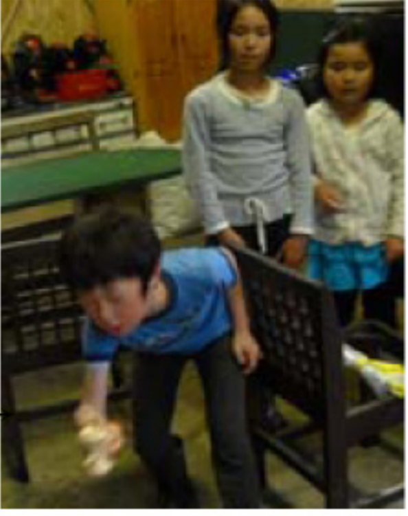
雨の日の野あそび会は→ けん玉大会に