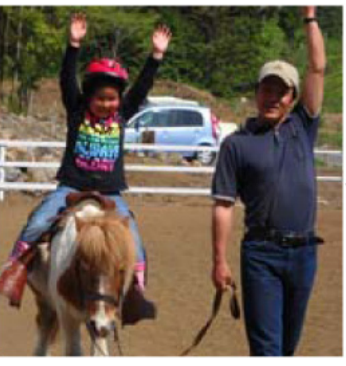
←6/12 療育学校ほおすき 1年生になった子たちの 特別メニュー