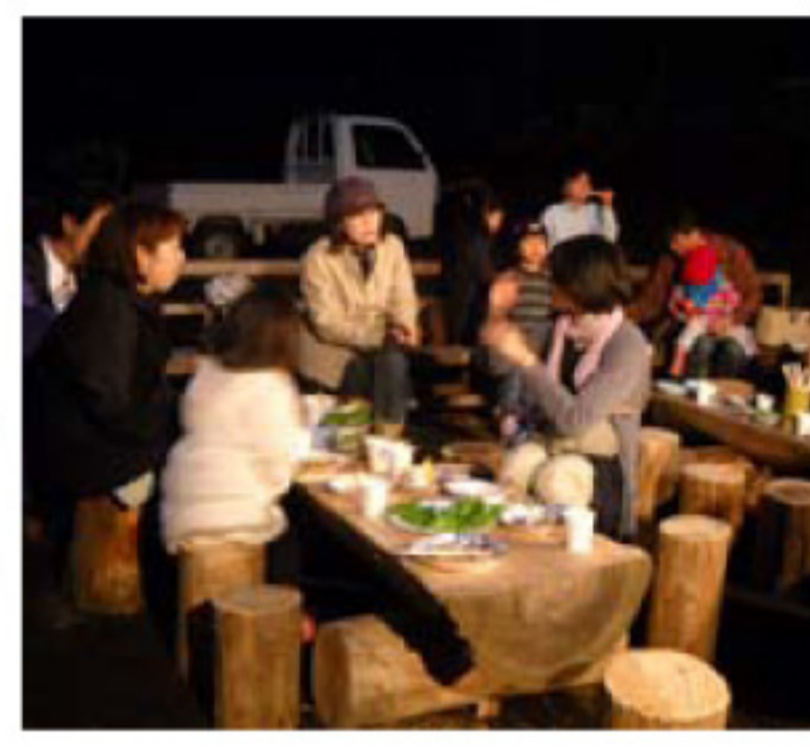
5/29 カタローヤ→ 野あそび会の父兄、ボランティ ア、スタッフとの“熱い”語らい