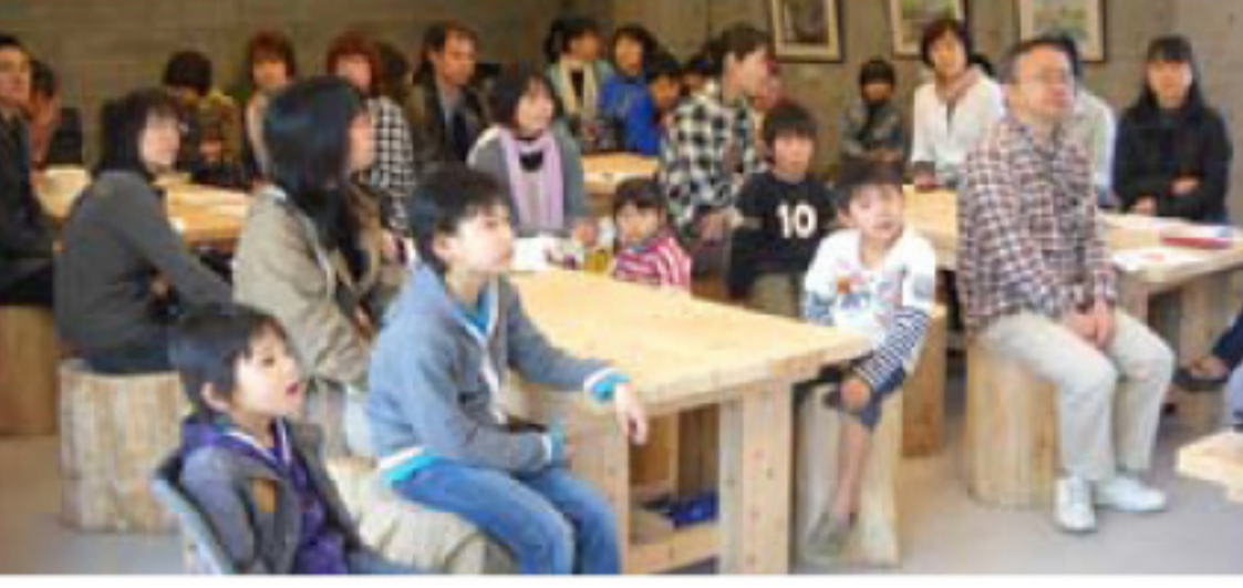
4/25 野あそび会発足会→ 富士山環境交流プラザにて